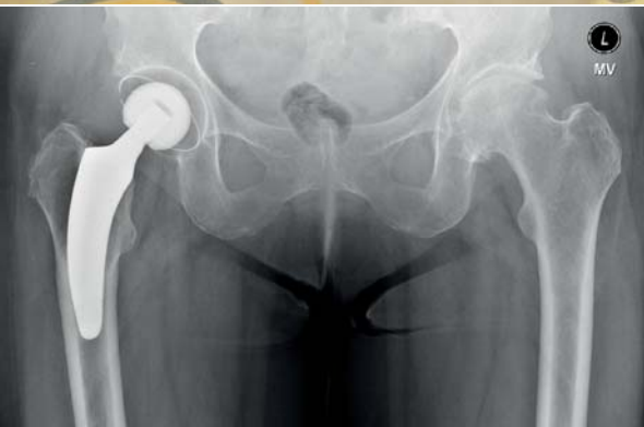
Oben: Das Team der Klinik für Unfallchirurgie und Orthopädie am KKH Stollberg Unten: Röntgenbild einer modernen Hüft-Kurzschafthoprothese